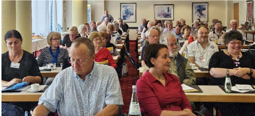
23.05.2024, Landesweite EFI-Fachtagung in Schwerin

Der Projekt- und Bildungsträger in M-V, der Landesring M/V des Deutschen Seniorenringes e. V., führt im Rahmen des Landesprojektes „Weiterbildung älterer Menschen für bürgerschaftliches Engagement als seniorTrainer*innen sowie deren fachliche Begleitung durch Agenturen“ landesweite Fortbildungsveranstaltungen für die bereits ausgebildeten seniorTrainer*innen durch.