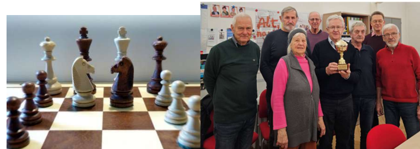
Schachgruppe gewann den Wanderpokal 2024

Kennen Sie das - „Die Dame ist die stärkste Figur?“ Finden Sie es gemeinsam mit erfahrenen Spielern der Schachfreunde Schwerin beim königlichen Spiel heraus! Erfreuen Sie sich an der Vielfalt im Schachspiel, an gelungenen Kombinationen, Gewinnpartien und lernen Sie aus Fehlern. Trainieren und testen Sie alle zwei Wochen Ihre geistige Fitness, egal, ob als Hobby-Schachspieler, als Wiedereinsteiger oder Anfänger! Schach dem König!