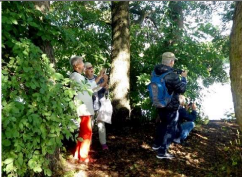
© Fotogruppe/ /Fotofreunde unterwegs am Lankower See

„Augen auf – immer und überall“ - heißt es für die Fotofreunde