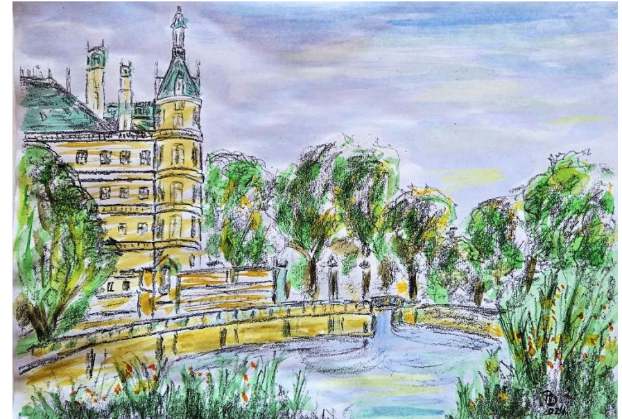
© Peter Düring, Kursteilnehmer „Wir malen weiter“